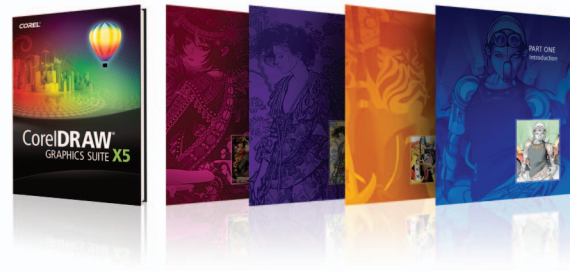
Die Box-Version der CorelDRAW Graphics Suite X5 wird mit einem gebundenen, vielfarbigem Handbuch ausgeliefert.

Nutzen Sie die neueste Windows®-Umgebung – Unter Windows® 7 können Sie CorelDRAW auf Touchscreen-Monitoren nun auch per Fingerzeig bedienen. Die neueste Version wurde für Windows 7 optimiert und unterstützt auch Windows Vista® und Windows® XP.